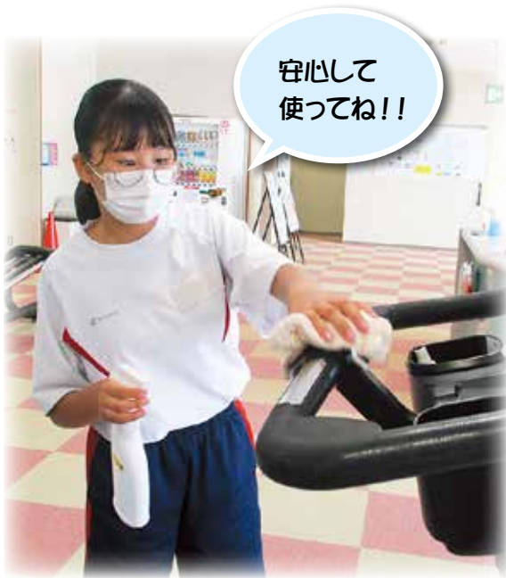
器具の消毒 (井原市芳井健康増進福祉施設 ASUWA)