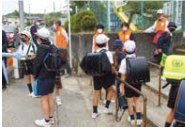
登校のあいさつ運動