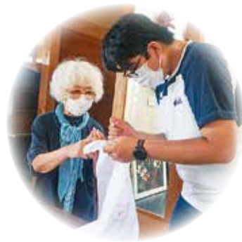
染め体験 (染織ボランティア サークル・あい)