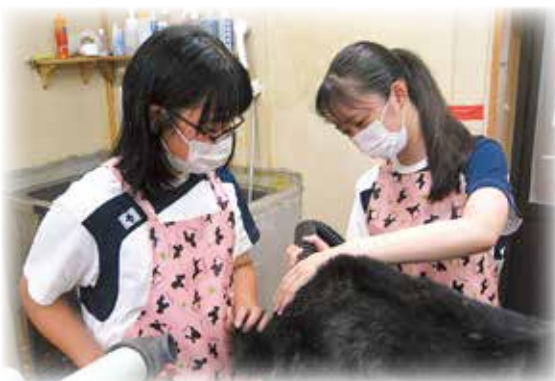
トリミングの手伝い (ペット美容室さくら)

『地域にとびだせ』をテーマに企業やボランティアグループなど、18の活動先で延べ96人の生徒がボランティア活動を行いました。活動先では、「自分たちができることは何か」を考え工夫しながら、接客や清掃などの活動をしました。 たくさんの人との出会いの中で、関わり、ふれあうことは、自分の良いところやできることに気づききっかけとなり、自己肯定感を高めることにつながっていきま す。 また、学校という枠組みから出て、地域社会とつながることで、地域に愛着を持ち、自らの生き方や地域の中で「ともに生きていく」ということの意味を考える機会にもなります。 井原市社会福祉協議会では、これからも学校や地域と一緒に子どもたちが成長できる取り組みを目指していききたいと思います。