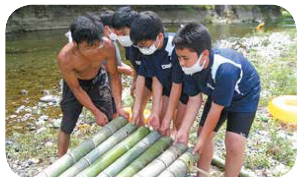
遊具づくり (ボランティアグループ わしがやらねば)