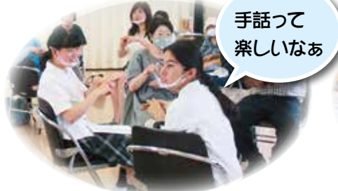
手話体験 (井原手話サークル)