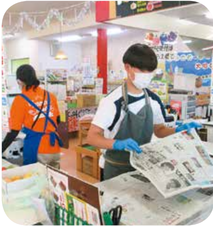
接客 (JA 晴れの国岡山 いばら愛菜館)