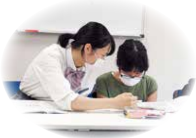
学習支援 (ボランティアグループ ABC の会)