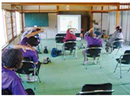
【ボランティアグループ 野の花】