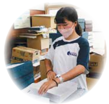
軽作業 (太陽の会作業所)