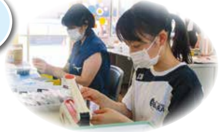
軽作業 (せいび夢空感)

夏のボランティア体験事業は、夏休みを利用して、中学生・高校生にボランティア活動に興味関心を持ってもらおうと体験する機会を提供するために実施しています。