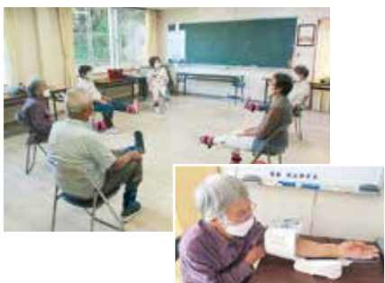
【明治地区社会福祉協議会】