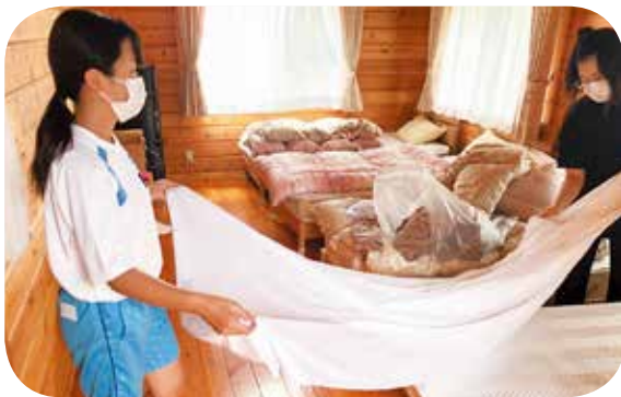
シーツ交換 (星空ペンション コメット)