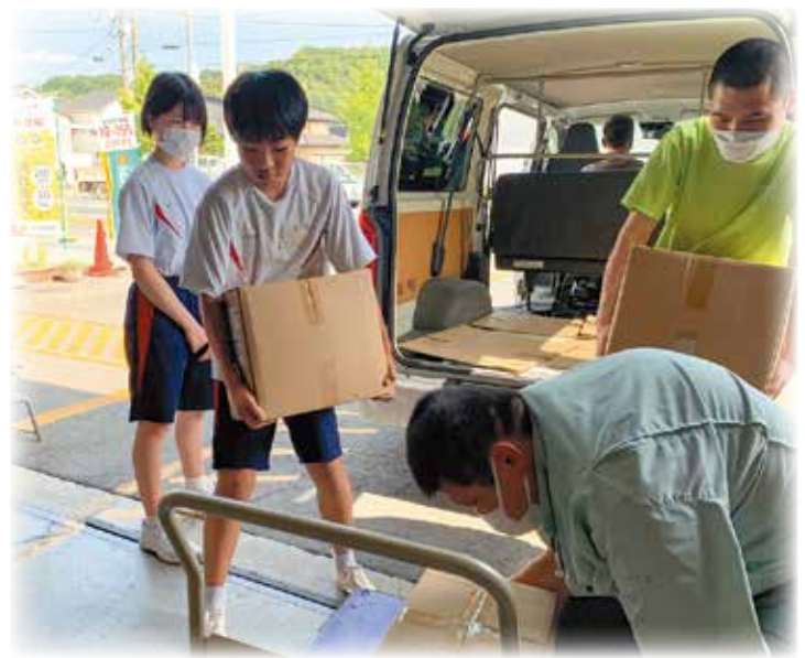
軽作業 (こだま園東江原ワーク)