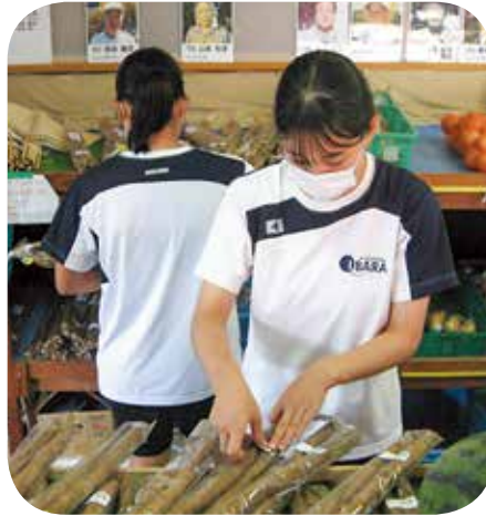
ラベル貼り (芳井町特産品直売所)