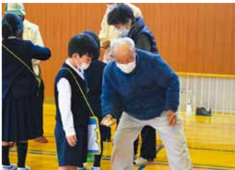
「昔遊びの会」 高屋小学校