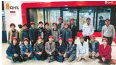
ふれあい・いきいきサロン活動