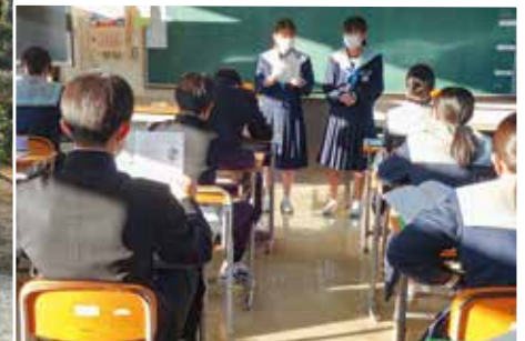
「赤い羽根共同募金広報活動」 高屋中学校