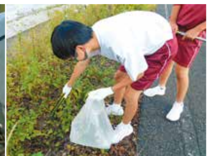
「学校近隣環境美化活動」 井原中学校

コロナ禍による制限がある中、地域ふれあい活動や学区内花いっぱい運動、クリーン大作戦などできることを自分たちで考え、学校と地域がつながる活動を実施されています。