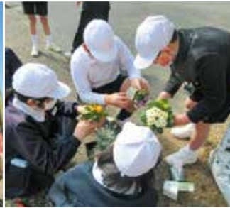
「長楽園と交流」 美星小学校