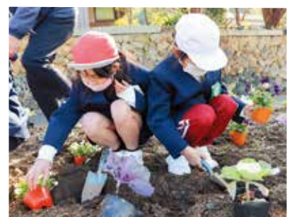
「ボランティア広場の花植え」 青野小学校

また、今年度は、『地域にとびだせ！夏のボランティア体験』を開催します。こちらも地域とのつながりを深めるよい機会になっています。