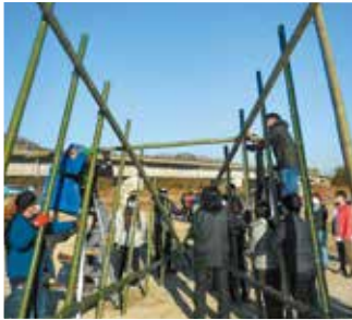
「地域に学ぶ〜とんど祭」 木之子小学校