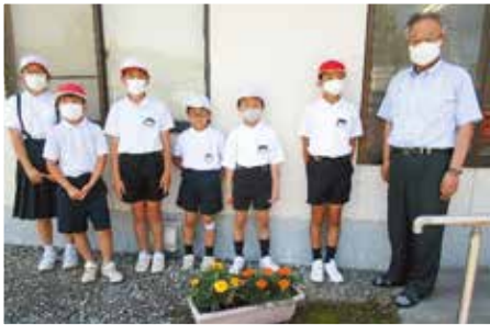
「花いっぱい運動」 荏原小学校