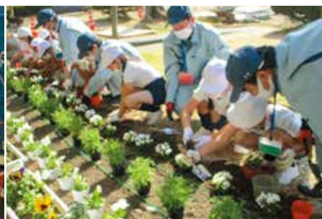
「井原高校と交流」 井原小学校