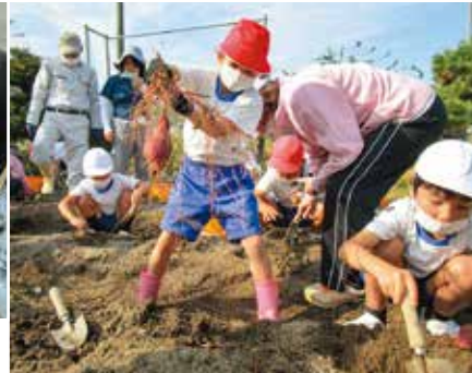
「地域と交流〜さつまいも掘り」 県主小学校