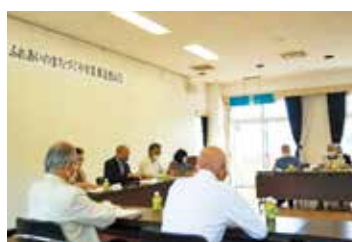
井原市総合福祉センターにて

今年度もコロナと共存しつつ、地域住民相互のたすけあいや交流の輪を広げ、地区社協と共に創意工夫し地域事業に取り組んでいきます。