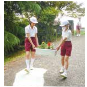
「明るい町づくり運動」 野上小学校