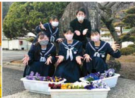
「地域のお花ボランティア」 芳井中学校