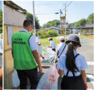
「クリーン大江」 大江小学校