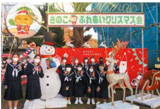
「きのこふれあいクリスマスイベント」 木之子中学校