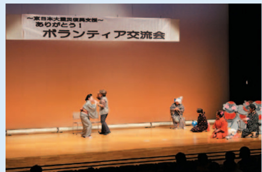
平成23年度出演の Tamachan's のみなさま

※応募多数の場合は抽選とさせていただきます。 出演者にはこちらから連絡させていただきます。